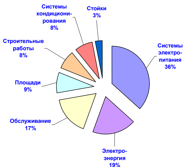
Рис. 2 – Распределение составляющих ПСВ для типичной стойки в компьютерном центре повышенной готовности (с резервированием 2N)

Анализ составляющих ПСВ позволяет понять возможности контроля и снижения расходов в различных областях.