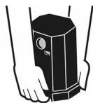
Forma correta de manuseio do produto