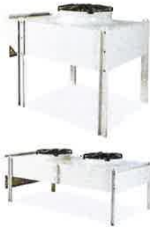
InRow DX condensers

References Références : ACCD75218, ACCD75216, ACCD75217, ACFC75257