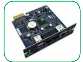
AP9631: Placa de Gestão