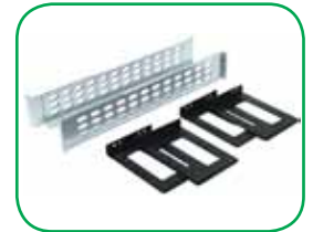
Kits instalação em bastidor