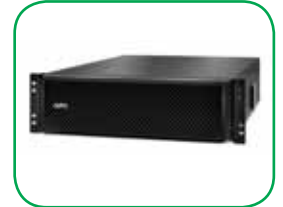
Conjunto de Baterias