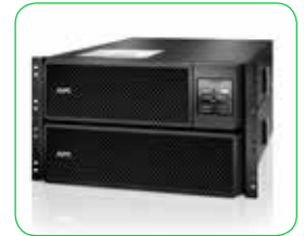
Paquetes de baterías