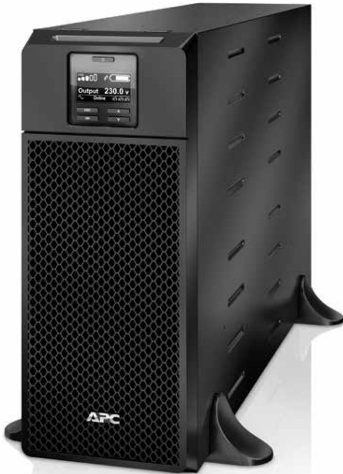
Modelo mostrado: SRT6KXLI