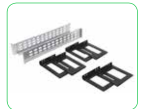
Kits de rieles