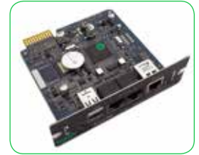
Tarjeta de comunicaciones