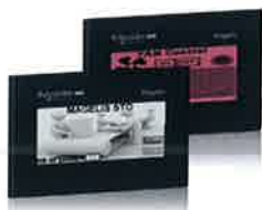
HMISTO 3.4" 緊緻型人機介面