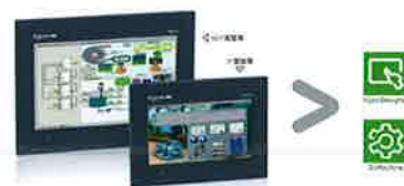
HMIGXO 16:9寬螢幕系列 全彩人機介面

施耐德電機股份有限公司 台北總公司 台北市114內湖區基湖路37號2樓 電話：02-8751-6388 傳真：02-8751-6398 www.schneider-electric.com.tw