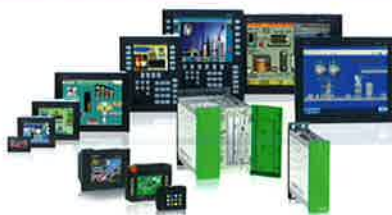
HMIGTO/HMIGTW/XBTGT/XBTGK 系列 全彩進階型人機介面