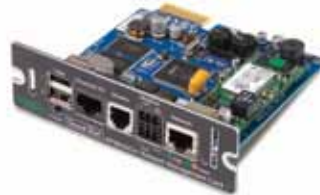
Carte réseau avec surveillance de l'environnement, accès hors bande et Modbus