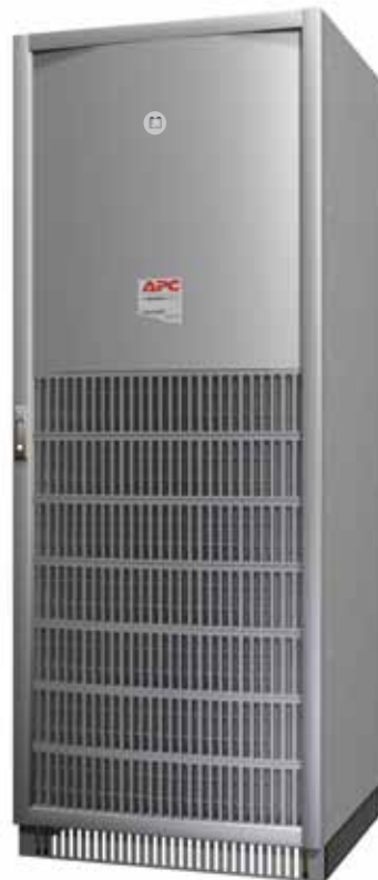
Armoire batteries du MGE Galaxy 5500