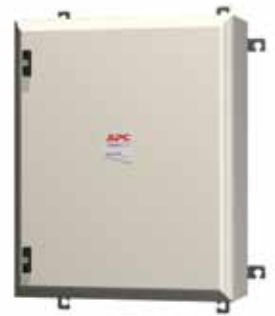
Coffret bypass mural