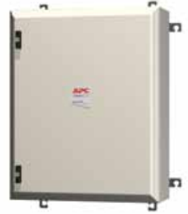
MGE Galaxy 5500, externer Bypass für Wandmontage