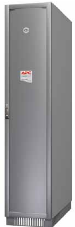
MGE Galaxy 5500 Transformator, 80 kVA - 120 kVA, im Zusatzschrank