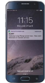
- Notifications 24/7 sur appareils mobiles