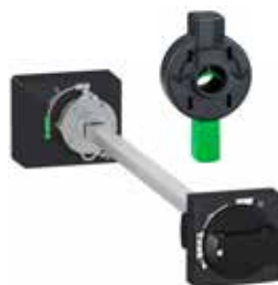
Axel manövrering vid öppen dörr, krav enligt UL508 / NFPA79