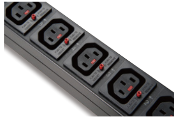
ロック機能付き IEC 320 C13 アウトレット