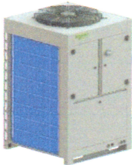
InRow 300mm Direct Expansion Air Conditioner

We, the undersigned SCHNEIDER-ELECTRIC INDUSTRIE SAS, declare that the above products, subject to installation according to the rules of the art, maintenance and use in accordance with their intended purpose, in accordance with the regulations, standards force in Morocco and the instructions of the manufacturer, comply with the requirements of the orders of the Minister of Industry, Trade, Investment and the Digital Economy No. 2574-14 and 2573-14 of 29 Ramadan 1436 (July 16, 2015):