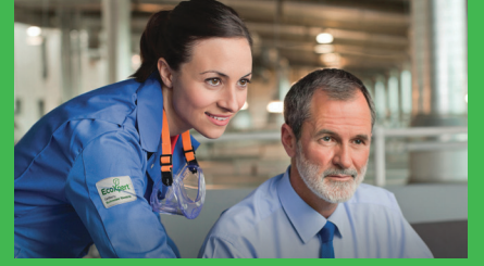
EcoXpert partner programını keşfedin