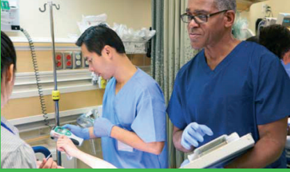
EcoStruxure Building Operation