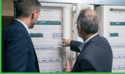
EcoStruxure Power Monitoring Expert