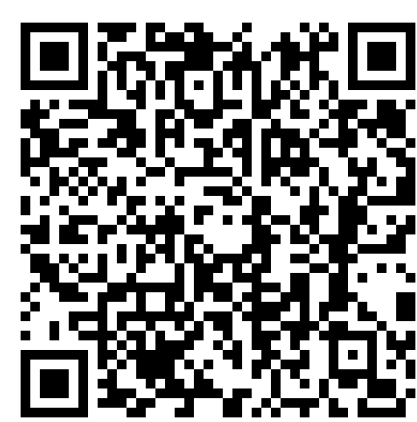
Manuale di installazione:

URL: https://download.schneider-electric.com/files?p_Doc_Ref=TME19696