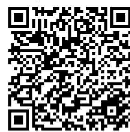
Guida di taglio:

URL: https://download.schneider-electric.com/files?p_Doc_Ref=TME19697