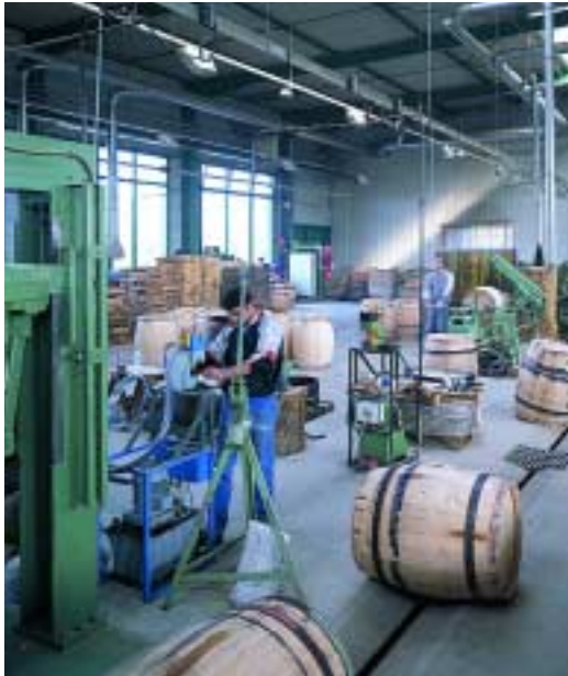
Elektrische distributie van een werkplaats waar tonnen worden gefabriceerd.

Naast de toepassing in de klassieke stroomverdeling voor verlichting kan CANALIS een enorme meerwaarde brengen bij projecten op een hoger technologisch niveau. Zo hebben progressieve studieburelen en installateurs CANALIS gekozen voor Data Center- en signalisatietoepassingen.