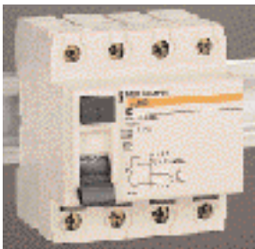
p. A38 - Differentieelschakelaar - ref. 23326

De differentieelbeveiliging onderbreekt automatisch een kring, indien tussen een fase en de aarde een isolatiefout optreedt. Zodoende bewerkstelligt zij de personenbeveiliging en de beveiliging van alle stroomafwaarts geïnstalleerde apparaten. De nieuwe differentieelschakelaar ID 80A, type A, schakelt met een gevoeligheid van 300 mA. Hij is goedgekeurd als scheidingschakelaar en verzekert de veiligheidsonderbreking zoals voorgeschreven in art. 235 van het AREI. Hij is ook erkend door CEBEC. Met de differentiële contactdoos PC kunnen kringen automatisch of door handbediening onderbroken worden indien er een isolatiefout optreedt, maar ook wanneer de spanning wegvalt. Zij beveiligen personen tegen het risico van directe aanraking en installaties tegen brandgevaar. Deze apparaten worden gebruikt in industriële omgevingen en in de tertiaire sector, maar ook in de woningbouw (vochtige of stoffiger ruimten). Zij kunnen ook in open lucht worden opgesteld. Hun voornaamste karakteristieken zijn: 230 VCA – 16 A en beschermingsgraad IP55. Tot dezelfde groep apparatuur voor differentieelbeveiliging van Merlin Gerin behoort ook het differentieelrelais Vigirex. Het wordt gebruikt in combinatie met andere