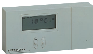
p. A124 - Thermostaat - ref. 15873

drukknopcommando's bepaalt de gebruiker zelf welke duurtijd gekozen wordt. Bij elke druk op de knop wordt de vertragingstijd opnieuw van nul gestart. Het gamma thermostaten voor de residentiële en de kleine tertiaire sectoren werd uitgebreid met de nieuwe TH/Amb, THPC/Amb, THD/Amb, THPA2/Amb, THPA4/Amb en THTC/Amb, voor het regelen van de omgevingstemperatuur. Zij sturen verwarmingstoestellen aan zoals convectoren, kleppen en branders. Zij regelen deze apparaten in functie van een ingestelde waarde (TH/Amb), van een ingestelde temperatuurwaarde en een ingestelde verminderingstijd (THPC/ Amb), van ingestelde tem-