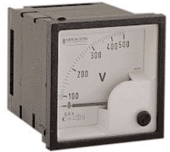
p. A131 - Voltmeter 72x72 - ref. 16005

Voor montage in deuren of afdekplaten van borden wordt een volledig nieuw gamma apparaten aangeboden. De voltmeters en ampèremeters, met afmetingen 72 x 72, gaan gepaard met de respectievelijk de voltmeteromschakelaars CMV en de ampèremeteromschakelaars CMA van 48 x 48.