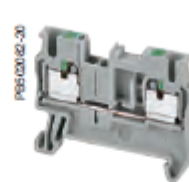
NSYTRP · ·