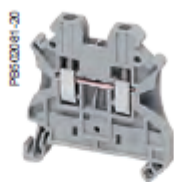
NSYTRV · ·