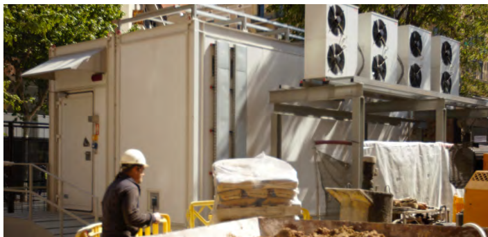
Die modulare All-in-One Lösung ist ideal für die Installation in im städtischen Umfeld.

Modulare Datacenter sind hier ideal geeignet. Vorgefertigte modulare Datacenter bieten Unternehmen einen großen Mehrwert bei der Umsetzung ihrer Edge-Computing-Strategie. Die Vorteile im Überblick: