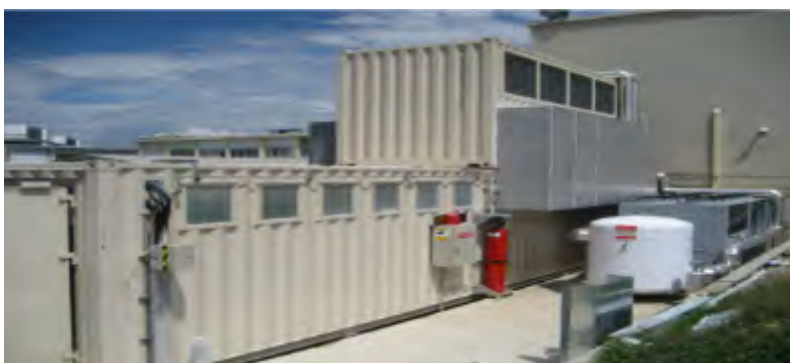
Modulares Datacenter von Schneider Electric, installiert im Animal Logic Animation Studio in Sydney, Australien.

Erfahren Sie, wie die Easy Modular Data Center All-in-One Lösungen von Schneider Electric auch Ihrem Unternehmen helfen können! Wenden Sie sich an einen unserer lokalen Vertriebsmitarbeiter oder besuchen Sie die Website für modulare Datacenter.