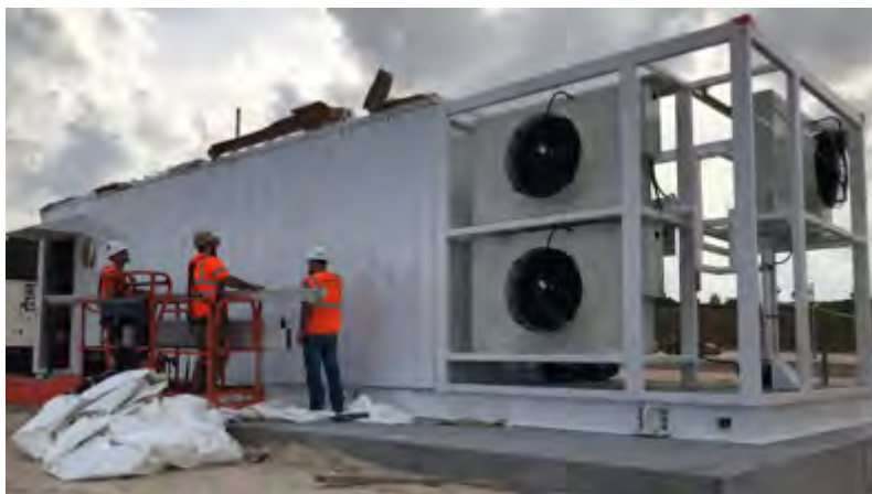
Modulare Datacenter für Lebensmittelhandel und Liefergeschäft.

Für Unternehmen oder Service Provider, die Edge-Datacenter einrichten, bietet Schneider Electric vier Standarddesigns mit 5 - 14 Racks und einer Kapazität von 20 - 100 kW sowie verschiedenen Redundanzoptionen an.