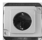
Type 270/S1B728302 shutter