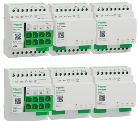
Master + 2 Erweiterungen

Erfahren Sie mehr über das einzigartige Master-/Erweiterung Konzept und weitere Vorteile von SpaceLogic KNX.