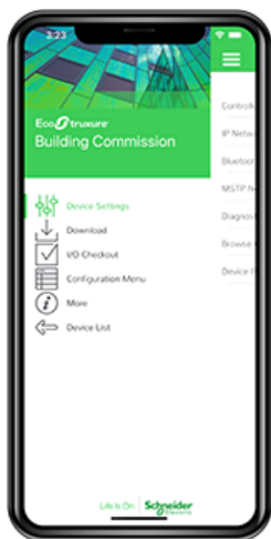
Applicazione mobile Commission

L'applicazione mobile è progettata per l'uso con dispositivi Android, Apple (iOS) e Microsoft Windows. Per maggiori informazioni, consultare la scheda tecnica EcoStruxure Building Commission.