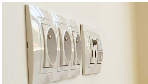
Vypínače, zásuvky, TV/SAT konektory v řadě Unica, které lze jednoduchou změnou rámečku přizpůsobit barvě podkladu