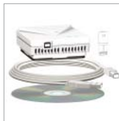
Kit de programmation pour PC