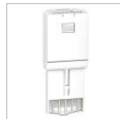
Clé de sauvegarde