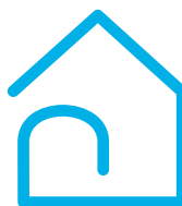
Gestion de l'éclairage résidentiel